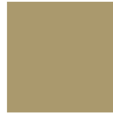
xal -CLASSIC 32 4201E82301A3F