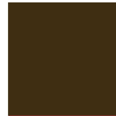
xal -CLASSIC 34 4201E82304A3F