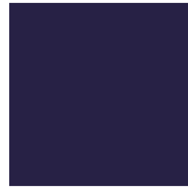
xal -TREND 7 4201H51578A3F