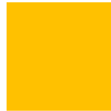
xal -DESIGN 16 4601A10280A10