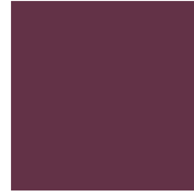
xal -TREND 5 4201H31210A3F