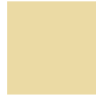
xal -STYLE 23 4201E76256A3F