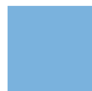
xal -DESIGN 17 4601A50240A10