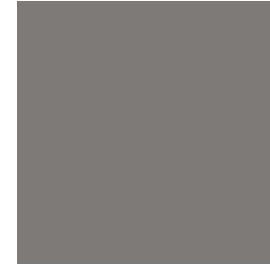
xal -TREND 6 4201E90071A3F