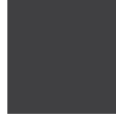
xal -TREND 3 4201E92246A3F