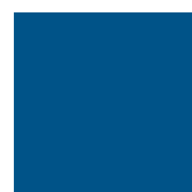
xal -DESIGN 18 4601A52433A10