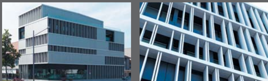
Bildlegende Raiffeisenbank, Dornbirn