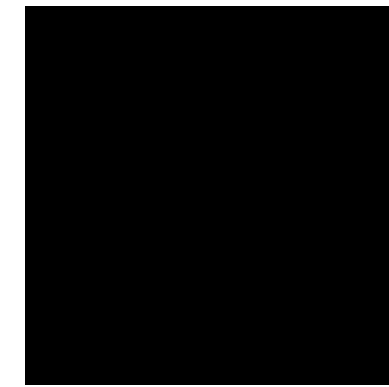
xal -TREND 9 4201A90050A10