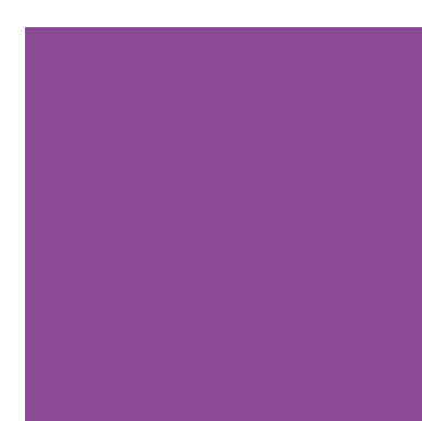
xal -DESIGN 19 4601A43590A10