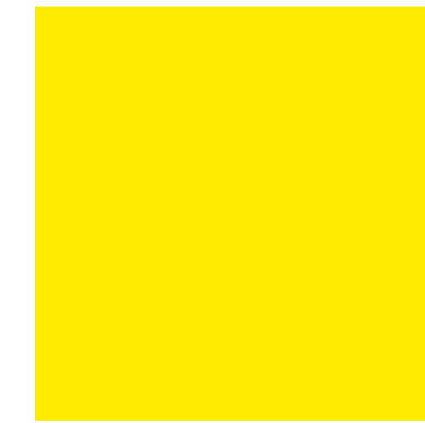
xal -DESIGN 11 4601A18930A10